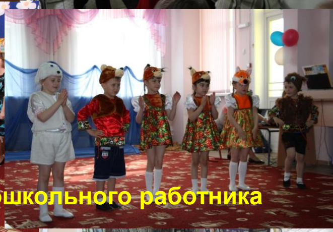
ТРАДИЦИЯ. Поздравление с днём дошкольного работника