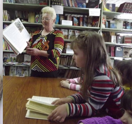
Взаимодействие с художественной школой и библиотеками