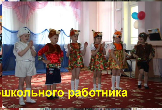
ТРАДИЦИЯ. Поздравление с днём дошкольного работника